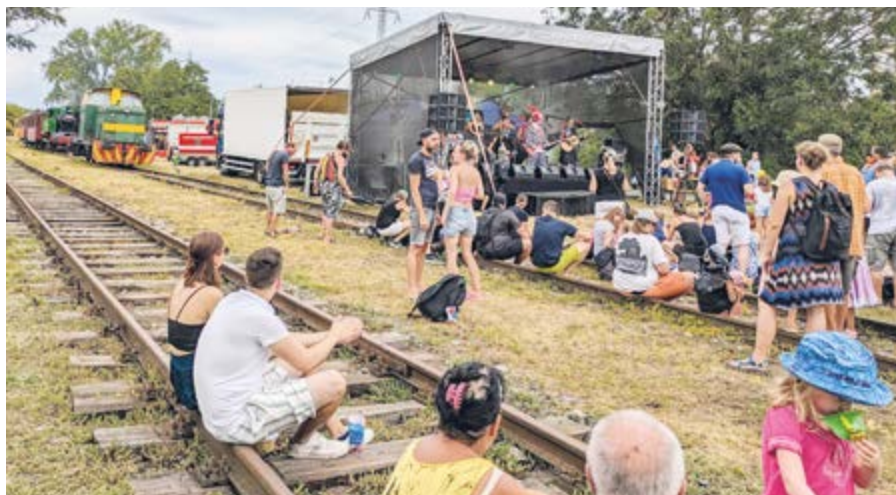
Na letošním festivalu vystoupila i kapela Kašpárek v rohlíku.